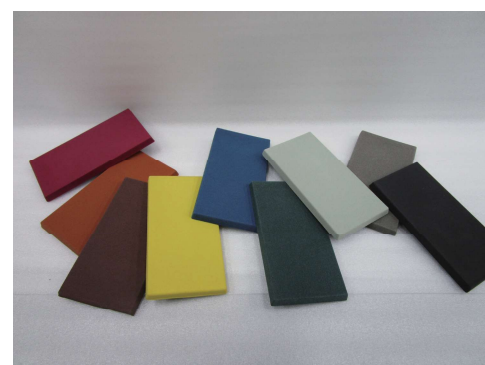
様々な色に着色可能